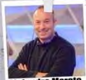
Alejandro Maroto Realización