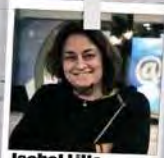
Isabel Lillo Realización