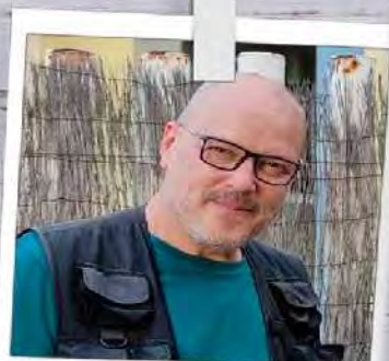
VICTOR M. CARRETERO Operador Video